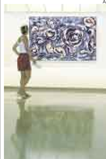
JACKSON POLLOCK. Sus obras en exhibición.

En el tránsito del siglo XIX al XX el influjo de la inmigración y la apertura al exterior de las clases enriquecidas abrió la diversidad de estilos artísticos, cercanos al impresionismo, pero también abiertos a plasmar la nueva visión de la ciudad y la industria con otras armas. ●