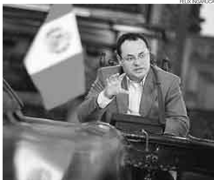
OPTIMISTA. El ministro de Economía, Luis Carranza, está convencido de que nuestra economía es una de las más competitivas de la región.

“Vamos a ver una reducción en los precios de 10% en estos productos (alimentos), porque los precios de importación van a entrar bastante más baratos que antes, y esto evidentemente va a reflejarse en un menor precio