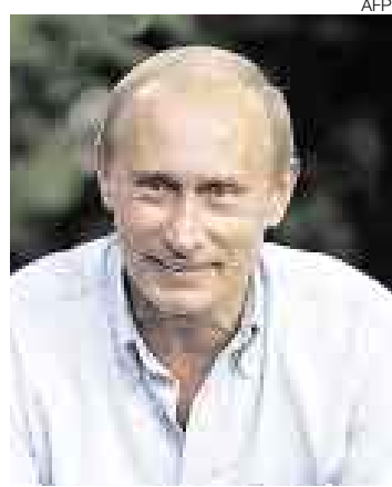
PUTIN. El líder ruso no se calla.

Washington planea colocar un interceptor de misiles en Polonia y un sistema de radares en la República Checa como parte de un