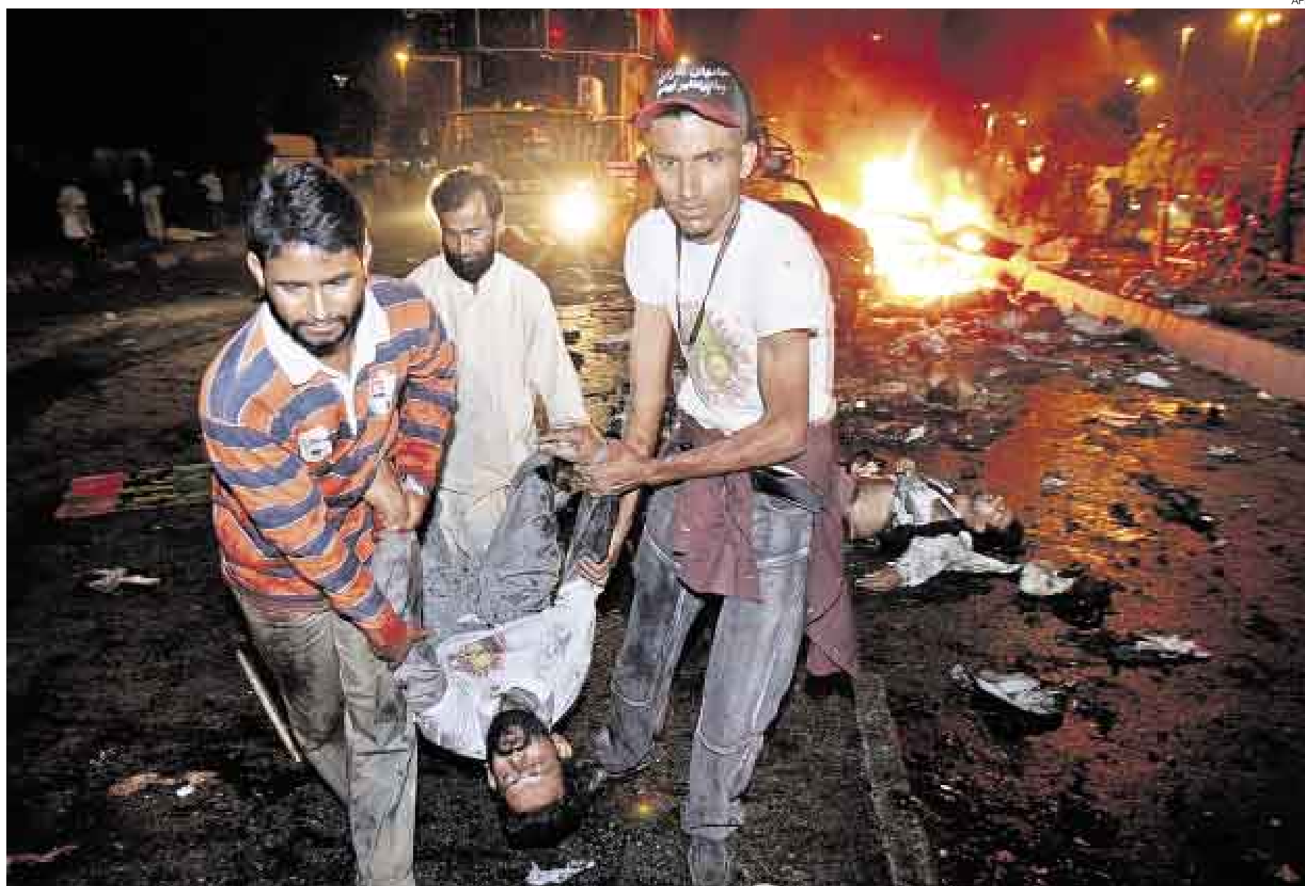
TRÁGICO REGRESO. Aproximadamente medio millón de personas se congregó en Karachi para recibir a Bhutto. Nadie se atribuyó el atentado.

El bastión de Bhutto bullía desde primeras horas de la mañana. Miles de personas ataviadas con los colores del PPP (rojo, negro y verde) bailaban por las calles, ondeaban banderas del partido y alzaban carteles con la