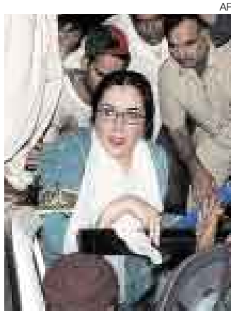
BENAZIR BHUTTO. Su regreso será un problema para el gobierno.

Con su regreso a Pakistán, Bhutto no solo quiere el triunfo de su partido en las elecciones parlamentarias de invierno, sino también desea volver a ser primera ministra. Para sus entusiastas seguidores de Karachi nada importa que en dos ocasiones (1990 y 1996) fuera destituida por los respectivos presidentes, acusada de corrupción y nepotismo. Ya desde el aeropuerto subrayó sus aspiracio-