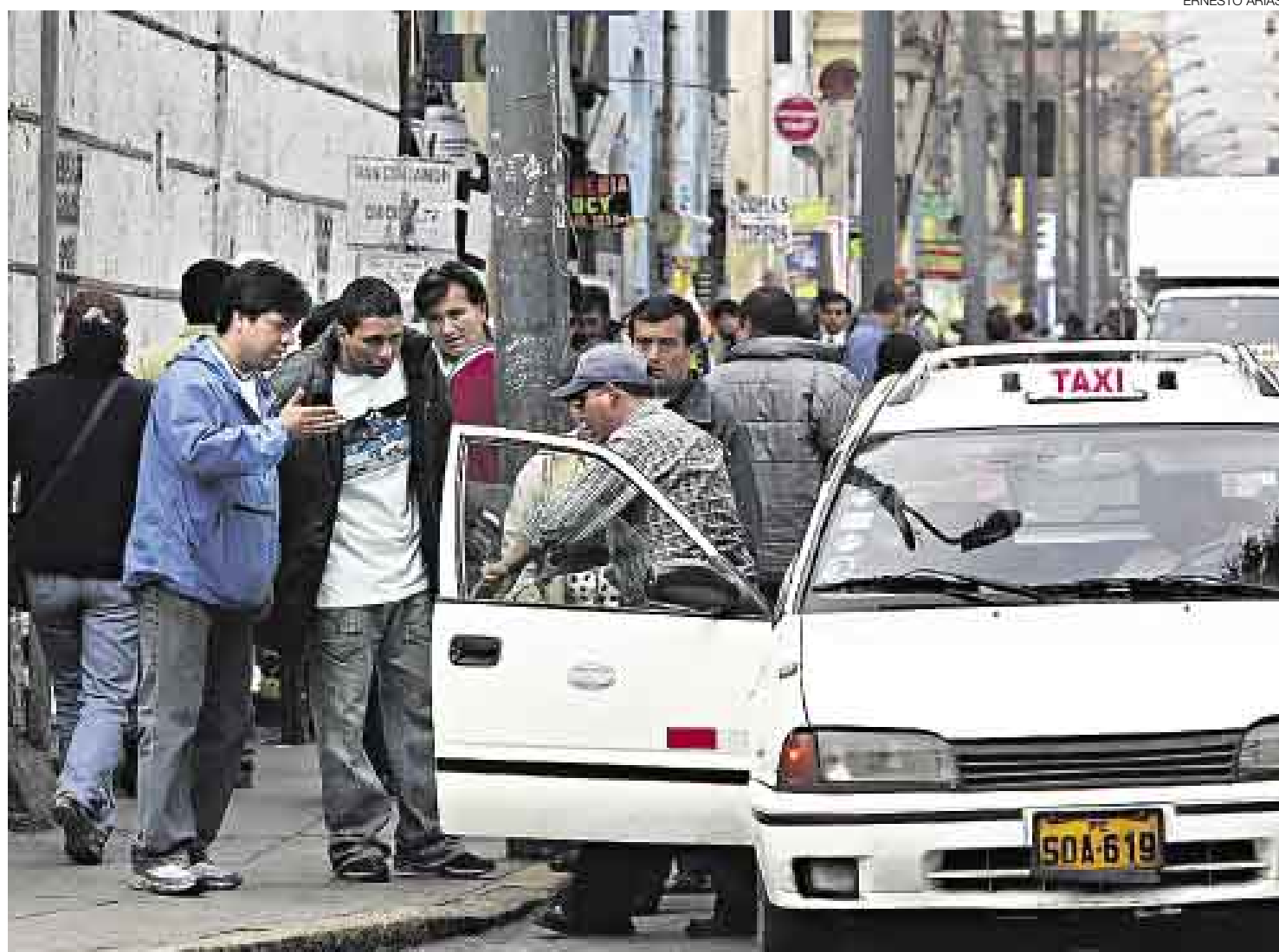
JR. AZÁNGARO. Emporio de la falsificación. La Presidencia del Consejo de Ministros y el Colegio de Notarios impulsan una campaña para acabar con este delito.

En las acciones estratégicas participarán la Policía Nacional del Perú (PNP), el Registro Nacional de Identificación y Estado Civil (Reniec), la Asociación de Bancos (Asbanc), la Superintendencia Nacional de Registros Públicos (Sunarp), el Instituto Nacional de Defensa de la Competencia y la Protección de la Propiedad Intelectual