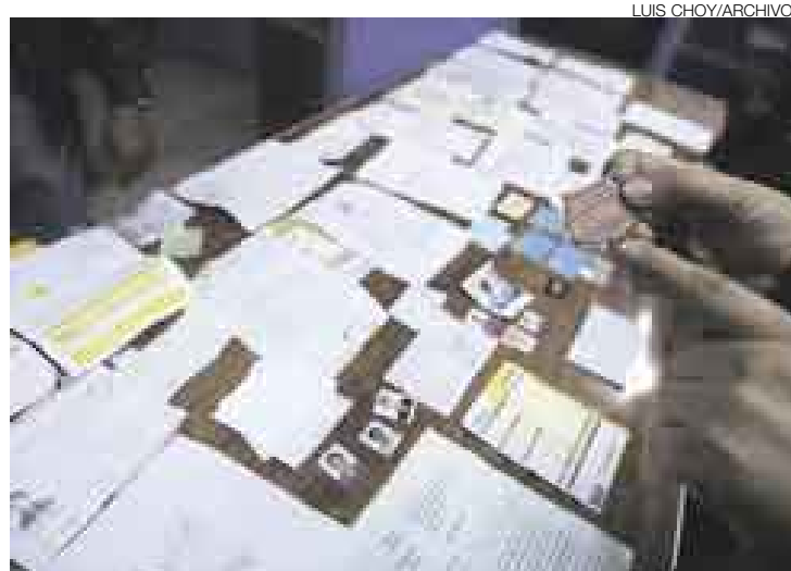
CAUTELADO. Las mafias de falsificadores tienen entre sus principales quehaceres usurpar nombres e identidad de notarios para cometer otros delitos.

De otro lado, el Colegio de Notarios de Lima precisó que en el presente año se ha reducido al 50% la falsificación de partes