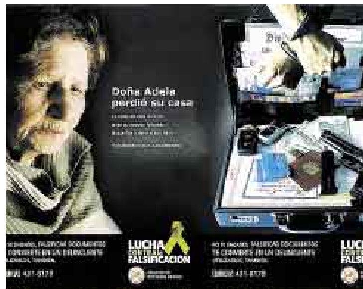
NO LO HAGAS. Este tipo de mensajes se transmitirán a la población. Apoyarán la Asociación de Agencias de Publicidad, Salmón & Salmón y Zeta Books.

La Dirección de Investigación Criminal (Dinincrí) ha informado que en lo que va del año se han registrado denuncias por falsifica-