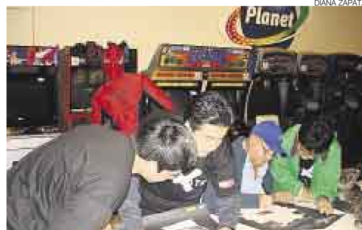
SUPERCRUCIGRAMISTAS. Las 25 duplas que participaron este sábado tuvieron que asumir grandes retos en el menor tiempo posible.

Para conocer la lista completa de clasificados, no olvide revisar el aviso publicitario que aparecerá hoy en el Diario. ■