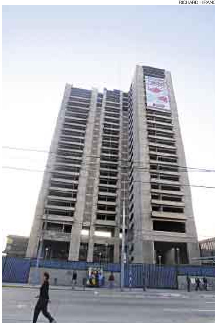
ESPERA COMPRADOR. Esta desaprovechada mole de concreto, que se levanta en la cuadra 13 de la avenida Arenales, por fin tendrá utilidad.

“Ya hemos saneado física y legalmente 24 propiedades en todo el país y vamos a anunciar su venta dentro de un par de semanas”, adelantó a El Comercio Fernando Barrios, presidente ejecutivo de Essalud, tras señalar que el objetivo es convertir los activos que están en desuso en capital de inversión para adquirir equipamiento médico y construir nuevos hospitales.