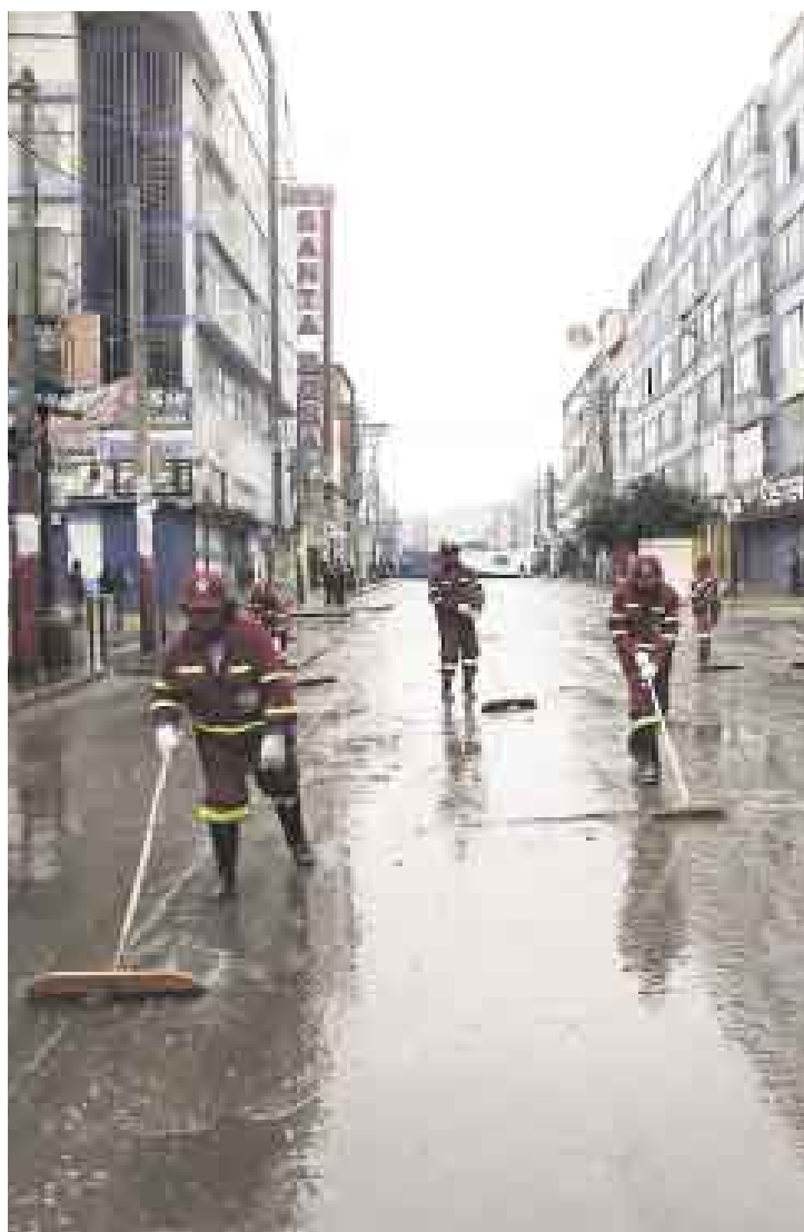
LIMPIEZA. Un equipo de trabajadores de la municipalidad de La Victoria aprovechó para darle una lavada a las calles de Gamarra.

únicos que podrán permanecer en las calles son los carretilleros y los conductores de puestos de emoliente o venta de periódicos debidamente organizados.