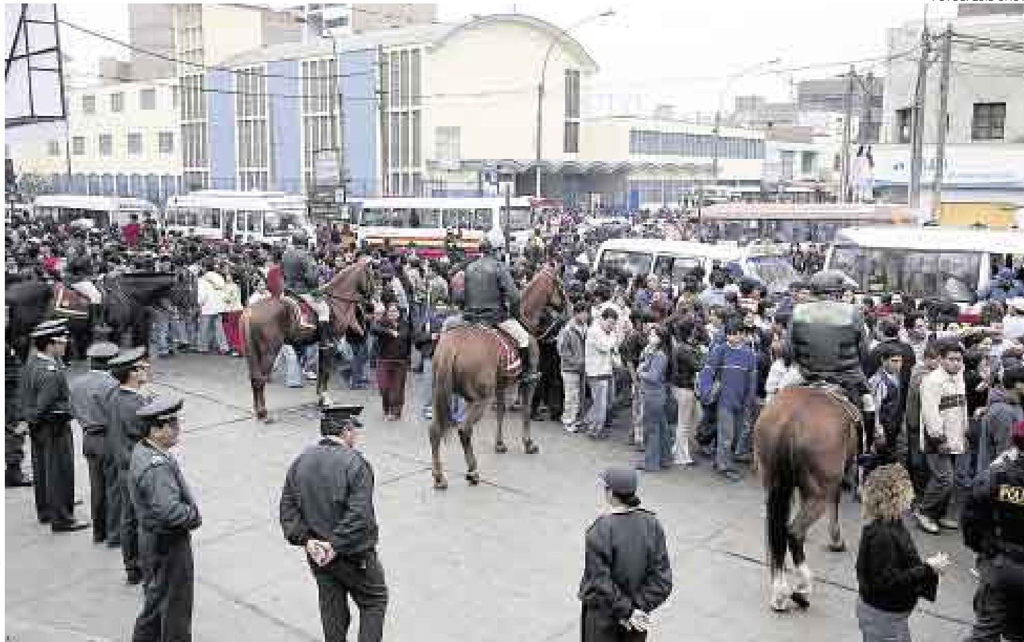
MEDIDA. El emporio de Gamarra quedó cerrado desde las 3:00 a.m. Efectivos policiales, algunos a caballo, tuvieron a su cargo la custodia del lugar.