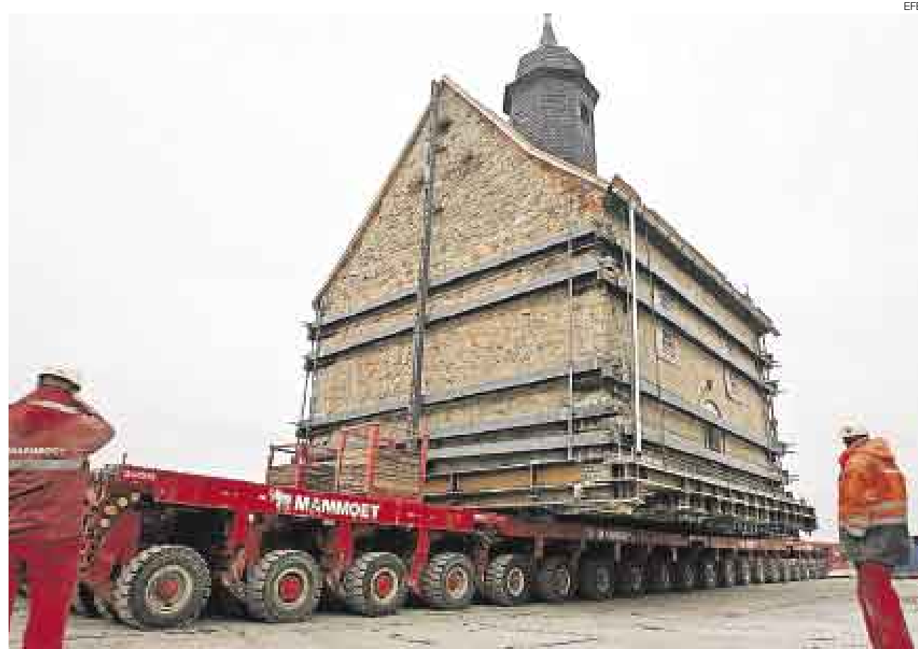
MONUMENTAL. Decenas de operarios se encargan del traslado. La apertura de una mina de carbón es la causa del alboroto.