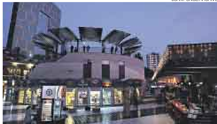
VENDE MÁS. LARCOMAR SUPERARÍA LOS US$30 MILL. EN VENTAS ESTE AÑO.

Al parecer, el ‘boom’ de los centros comerciales en el país animó, por fin, al directorio del Centro Comercial, Turístico y de Entretenimiento Larcomar a ampliar sus operaciones en el país. Fuentes vinculadas a la empresa informaron que sus operadores anunciarían en breve al menos dos proyectos para desarrollar complejos comerciales y turísticos, uno de los cuales estaría