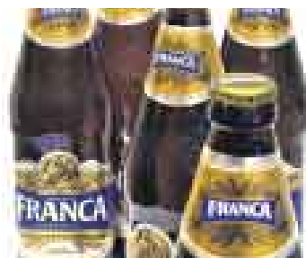
FALTA DE PRESENCIA. FRANCA AÚN NO SE VENDE EN TODOS LADOS.

A pesar de ser la imagen de la campaña de lanzamiento de la cerveza Franca , el popular chef Gastón Acurio aún no se decide por incluir dentro de la carta de bebidas de sus restaurantes la marca del grupo Ajeper . ¿El motivo? Pues el tamaño; la botella de 700 ml no convence a los comensales, ya que el envase oficial en el que se sirven las bebidas es el personal. Los Añaños tendrán que trabajar en ese tamaño para tener su producto en dicha vitrina.