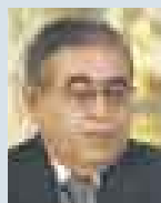
JUAN VALDIVIA, MINISTRO DE ENERGÍA Y MINAS.

● Primero derramaron leche por las calles de Trujillo. Ahora, sacrifican animales para que les hagan caso. No está en discusión la legitimidad de los reclamos de los productores de leche. Lo que preocupa es que parecen no tener límites en sus medidas de protesta. ¿Qué podría venir luego?