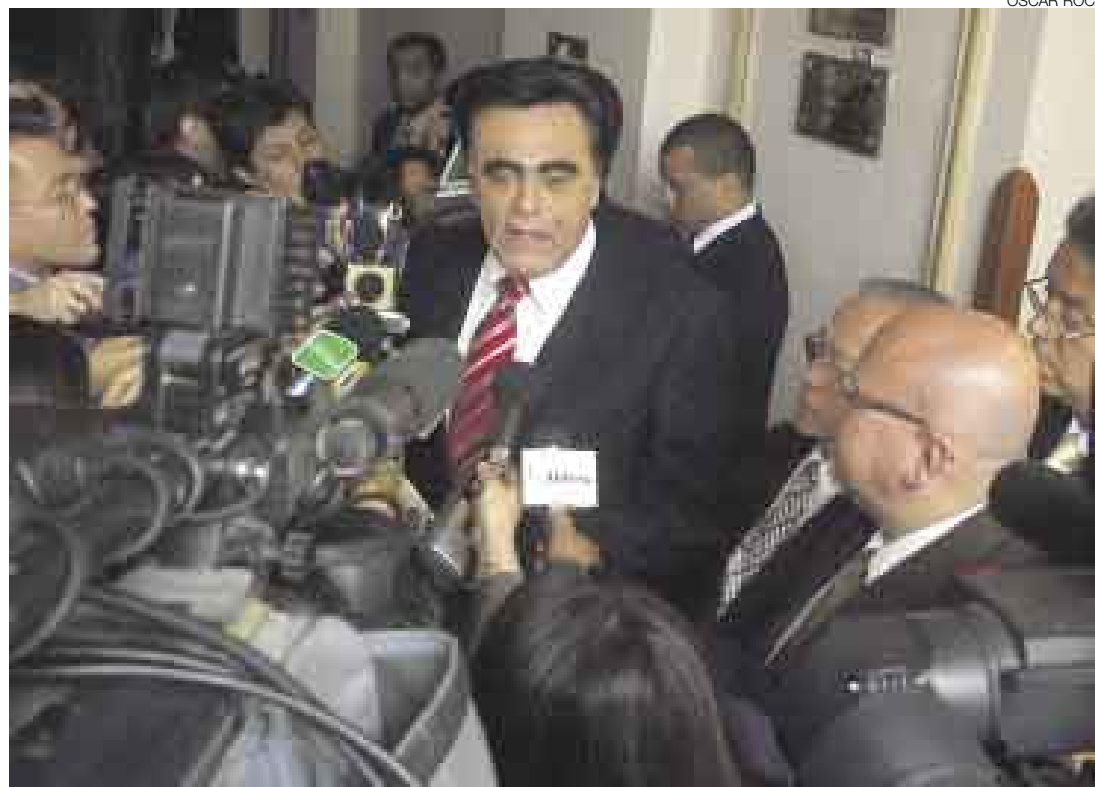
JUSTIFICACIÓN PARA TODO. Luis Gonzales Posada aludió al reglamento del Congreso para defender la decisión.

"Lo único que se ha hecho es cumplir con el artículo 22 del reglamento del Congreso", se defendió el actual titular del Congreso Luis Gonzales Posada cuando se le preguntó la razón por la que se modificó el acuerdo estipulado en la época de Cabanillas. "La línea de austeridad del Congreso no ha sido afectada, no se ha aumentado sueldos ni remuneraciones ni gastos operativos", dijo Gonzales Posada.