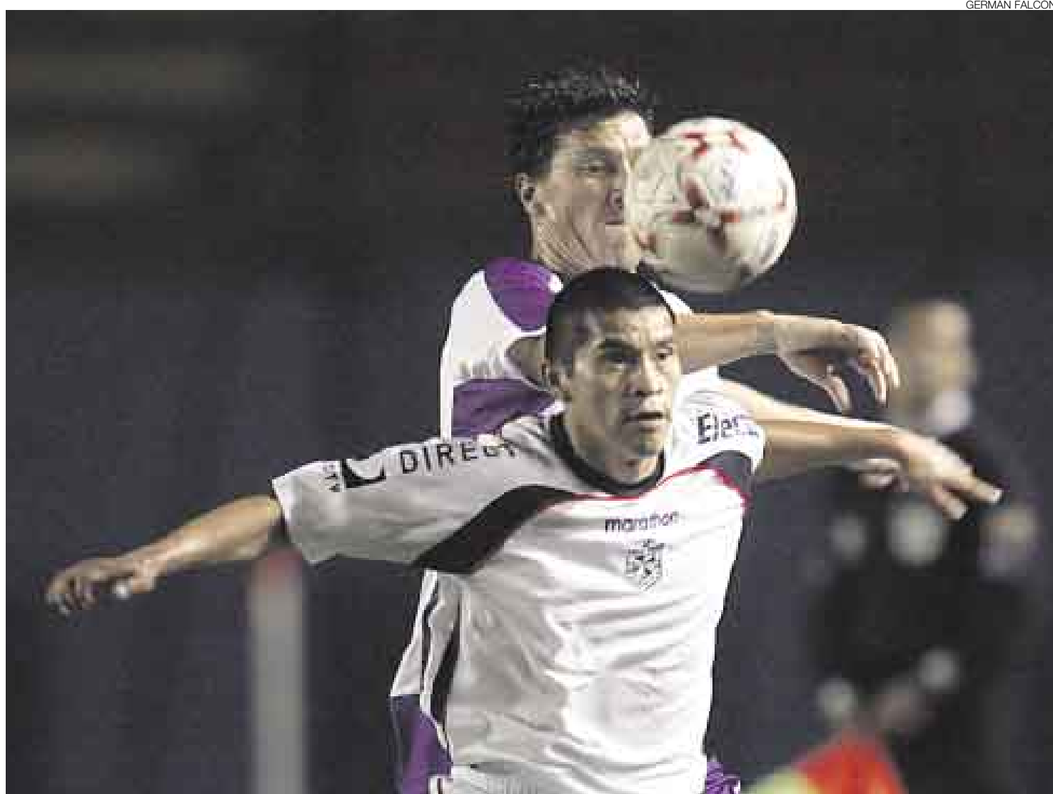
IGUALES. La Universidad no supo y Alianza no concretó. El empate sin goles refleja los groseros errores en definición de ambos equipos.