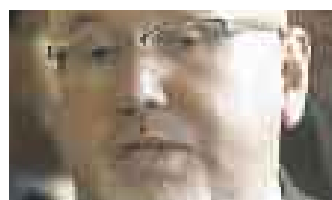
CARLOS BRUCE CONGRESISTA

“No estoy de acuerdo con cambiar un ministro, salvo que sea un reverendo corrupto. No vamos a votar por la censura, y por favor no me aplauda por eso, señor Velásquez Quesquén”.