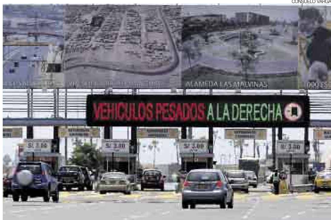
CONFUSO. En el peaje de San Pedro se debe volver a pagar, pese a que ya hubo un cobro en la garita de Villa.