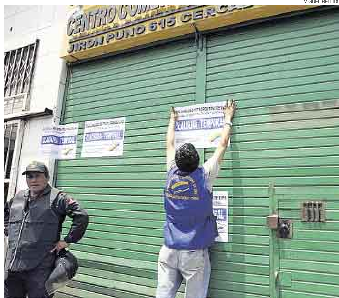
INSEGURAS. Luego del incendio ocurrido el viernes último, la Municipalidad de Lima inició ayer la inspección de galerías en Mesa Redonda y procederá a clausurar las que incumplen la ley.

Ayer, los inspectores y 20 fiscales provinciales del delito intervinieron 18 galerías y cerraron cinco temporalmente. Entre ellas, el Centro Comercial Santa Catalina (jirón Puno 615), las tiendas contiguas que funcionaban en las direcciones 623, 642, 647 de esta misma calle y el local ubicado en la dirección 1132 del jirón Andahuaylas. Los dueños de los centros comerciales tienen un plazo de 13 días para despejar sus pasillos de mercadería inflamable, equipar su local de sistemas contra incendios y, sobre todo, regularizar