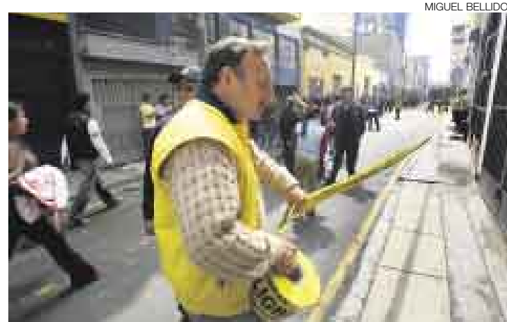
CAMBIO. La inspección de los locales estará a cargo de los gobiernos regionales a partir del 1 de enero del próximo año.

Esta separación de competencias dificulta muchas veces la fiscalización. Ayer los inspectores de Defensa Civil de la Municipalidad de Lima indicaban que ellos solo supervisaban los puestos de las galerías de Mesa Redonda, pero los corredores, sótanos y almacenes le correspondían al Indeci. En teo-