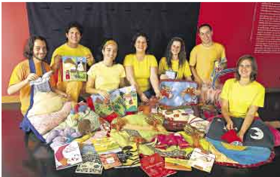
BRASIL. Representantes de Os Tapetes Contadores de Historias que narrarán cuentos con la ayuda de tapetes.