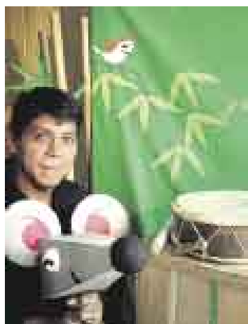
PERÚ. Kabana contará historias inspiradas en sus raíces japonesas.

Había una vez un montón de cuentacuentos peruanos que se presentaron en los locales de la Asociación Cultural Peruano-Británica. Fue tal el éxito que invitaron a un montón de cuentacuentos más que llegaron a Lima para regalar historias a grandes y chicos por igual. Este podría ser el inicio de la historia de "Cuéntamelo", el Primer Encuentro Internacional de Cuentacuentos organizado en Lima. Una jornada internacional itinerante (en los locales del Británico de Lima) y, lo que es más atractivo, gratuita. El objetivo es ofrecer un espectáculo de excelente calidad al que público