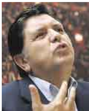
HORTELANO 2. García criticó que Estado tenga bienes en desuso.

SANTIAGO DE CHILE. ¿Usted asegura que se realizará una subasta para la venta de los inmuebles del Estado y que se hará con transparencia?, se le preguntó ayer al presidente García. “Naturalmente. Si alguien quiere ensuciarse no seré yo”, fue su respuesta.