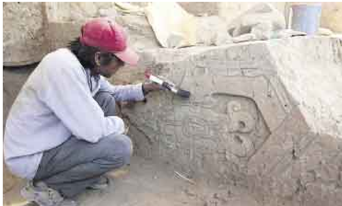
¿INFLUENCIA? En otro templo, en la zona de Collud, se halló estos relieves típicos del Chavín Antiguo.