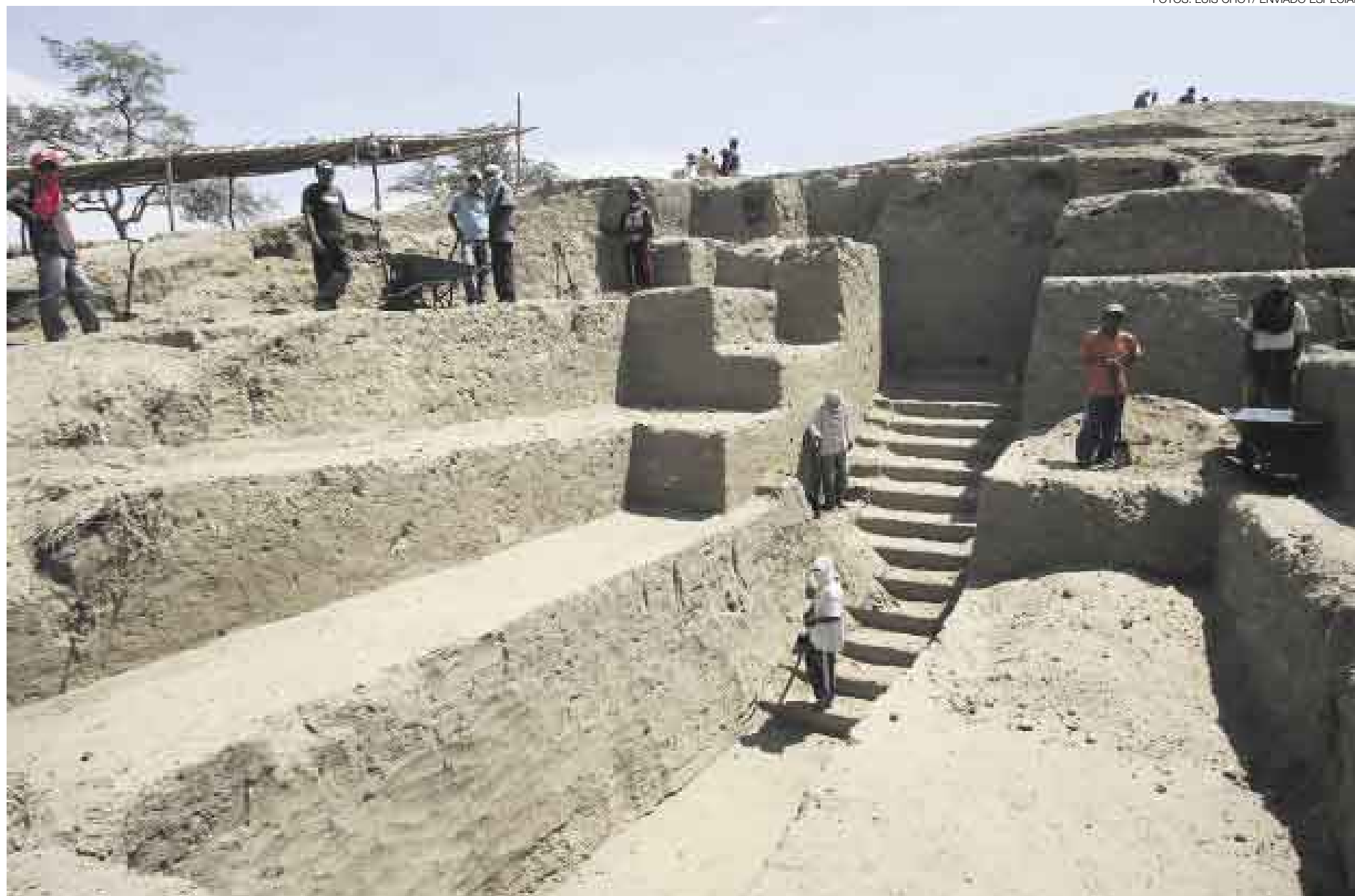
ADORATORIO. Los cuidadosos trabajos de los arqueólogos logran hacer resurgir la imponente estructura del 'templo del venado cautivo'. Sus muros se elevan hasta los seis metros y medio.

Mientras decenas de trabajadores continuaban con el desentierro del prehistórico templo, Alva trataba de descifrar las escenas hasta que, luego de varios días de análisis, concluyó que se trataba de escenas repetitivas, en las que se aprecia una red multicolor dentro de la cual se observa un venado cautivo tratando