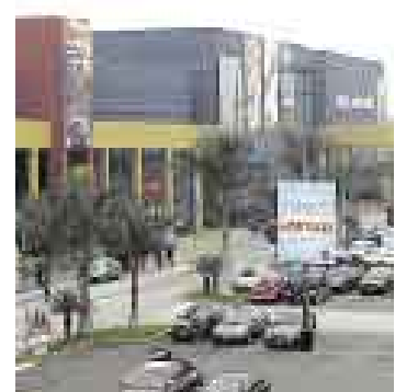
MÁS. TRES MILLONES DE VISITAS ESTIMA EL JOCKEY PLAZA EN DICIEMBRE.

De otro lado, en los próximos días habrá novedades en cuanto a operadores en el Jockey Plaza. Así,