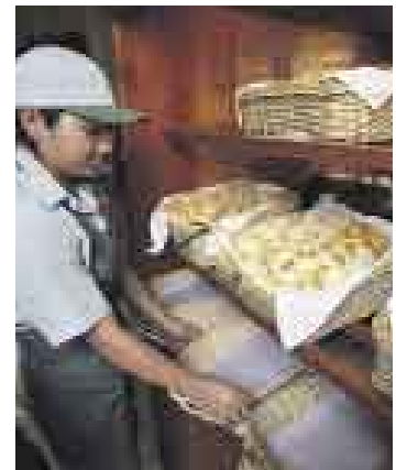
VARIEDAD. SWEET GARDEN OFRECERÁ MÁS OPCIONES DE PANES.

El concepto de Sweet Garden se basa en ofrecer productos de pastelería fina, para lo cual han instalado una planta especializada. Actualmente, el 70% de insumos utilizados es importado y el objetivo es reducir esta cifra al 50%.