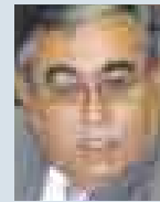
JUAN VALDIVIA, MINISTRO DE ENERGÍA Y MINAS.

● El Congreso vuelve a darle la espalda a la demanda de inversiones del país, al retrasar el proyecto de incentivos a la industria petroquímica. Estuvo claro, en el último pleno, que la intención del Partido Nacionalista era negarse a todo, ya que el proyecto fue modificado una y otra vez. Y esta semana, el tema podría ser archivado.