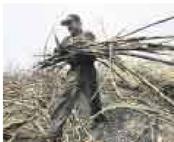
NEGOCIO. PESE A TODO, CRECE EL NÚMERO DE PROYECTOS DE ETANOL.

Los productores azucareros no han desistido de luchar para que el Estado brinde algún tipo de promoción al negocio del etanol. No lograron que el ministro de Economía, Luis Carranza , eliminase el Impuesto Selectivo al Consumo (ISC) a este producto, así es que ahora procurarán que el etanol sea incorporado a los beneficios de la Ley de Promoción Agraria . Por lo pronto, tendrán de su lado al ministro Ismael Benavides . ¿Será suficiente?