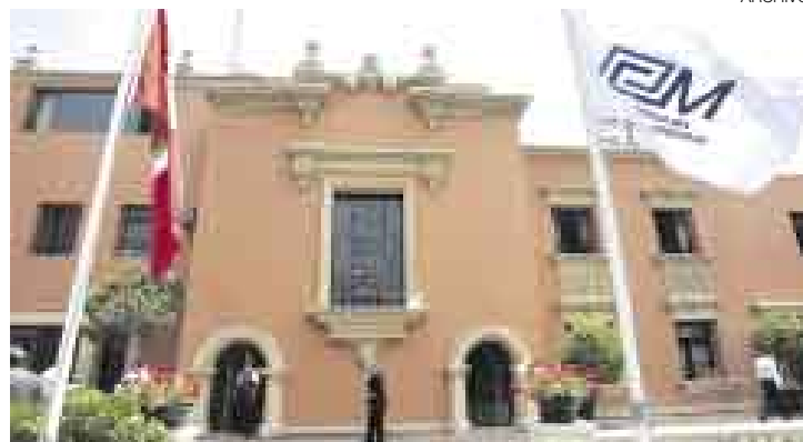
HABRÍA OTROS. EL LOCAL DE LA PCM NO HABRÍA SIDO EL ÚNICO EN LA MIRA.

El (aún) ministro de Vivienda, Hernán Garrido Lecca , no solo formuló un amago de renuncia porque el Gobierno se negó a vender el local de la PCM para replicar los edificios que Imagina tiene al frente, sino también porque habría querido replicar el cuento en San Isidro y Miraflores , y no le hicieron caso. Trascendió que el ministro habría pedido a cada institución pública con sede en los men-