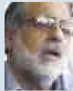
DANIEL ABUGATTAS, CONGRESISTA DEL PARTIDO NACIONALISTA.

● No se lo puede responsabilizar por el eterno problema de la educación en el Perú, que fue puesto otra vez en el tapete por los resultados de un estudio del World Economic Forum. Sin embargo, tras el impulso inicial para detener al Sutep, en su gestión no se ve grandes avances. La brújula no apunta al norte.