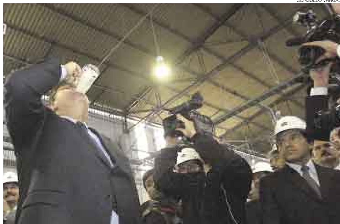
¿SALUD POR ESO? El presidente García recalcó que se debía diferenciar los principios ideológicos de los intereses económicos y que por el bien del país sería bienvenida la inversión venezolana para la explotación petrolera.

García declaró el viernes en Chile que había invitado a Chávez, debido a que el Perú necesita inversión en exploración petrolera y en la modernización de las refinerías del norte. Agregó que había