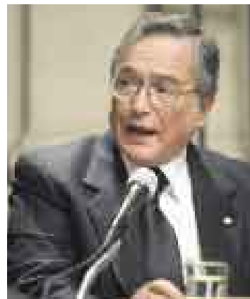
PEASE. Es el coordinador del encuentro de cinco días en la PUC.

Hay frases que pueden reflejar el sentir de muchos peruanos, como la expresada ayer por el ex presidente del Congreso Henry Pease: “El Estado Peruano sigue siendo limeño y no llega a gran parte del país”. Para Pease, en nuestra nación sigue pasando lo mismo que en los años ochenta, cuando Sendero Luminoso decía que había liberado una zona y en realidad había ocupado vacíos. “El Estado no puede dejar vacíos”, remató Pease horas antes de iniciarse el seminario “Reforma de Estado en el Perú”, organizado por la Universidad Católica, en el cual