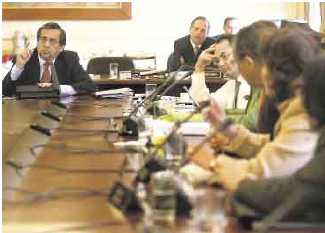
SUELO PAREJO Parece que por el momento tendrán que esperar los cambios en el Gabinete Del Castillo.

■ Cambios se darían cuando terminen los pedidos de censura en el Congreso