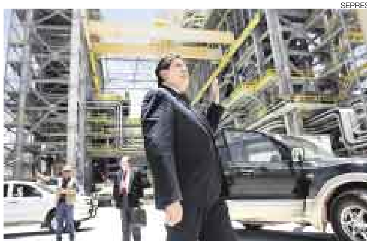
CONTENTO. Los 8 puntos recuperados le trajeron alegría al mandatario.

Según una encuesta hecha en Lima Metropolitana por la Universidad Católica, García pasó del 30% en octubre al 38% en noviembre básicamente porque