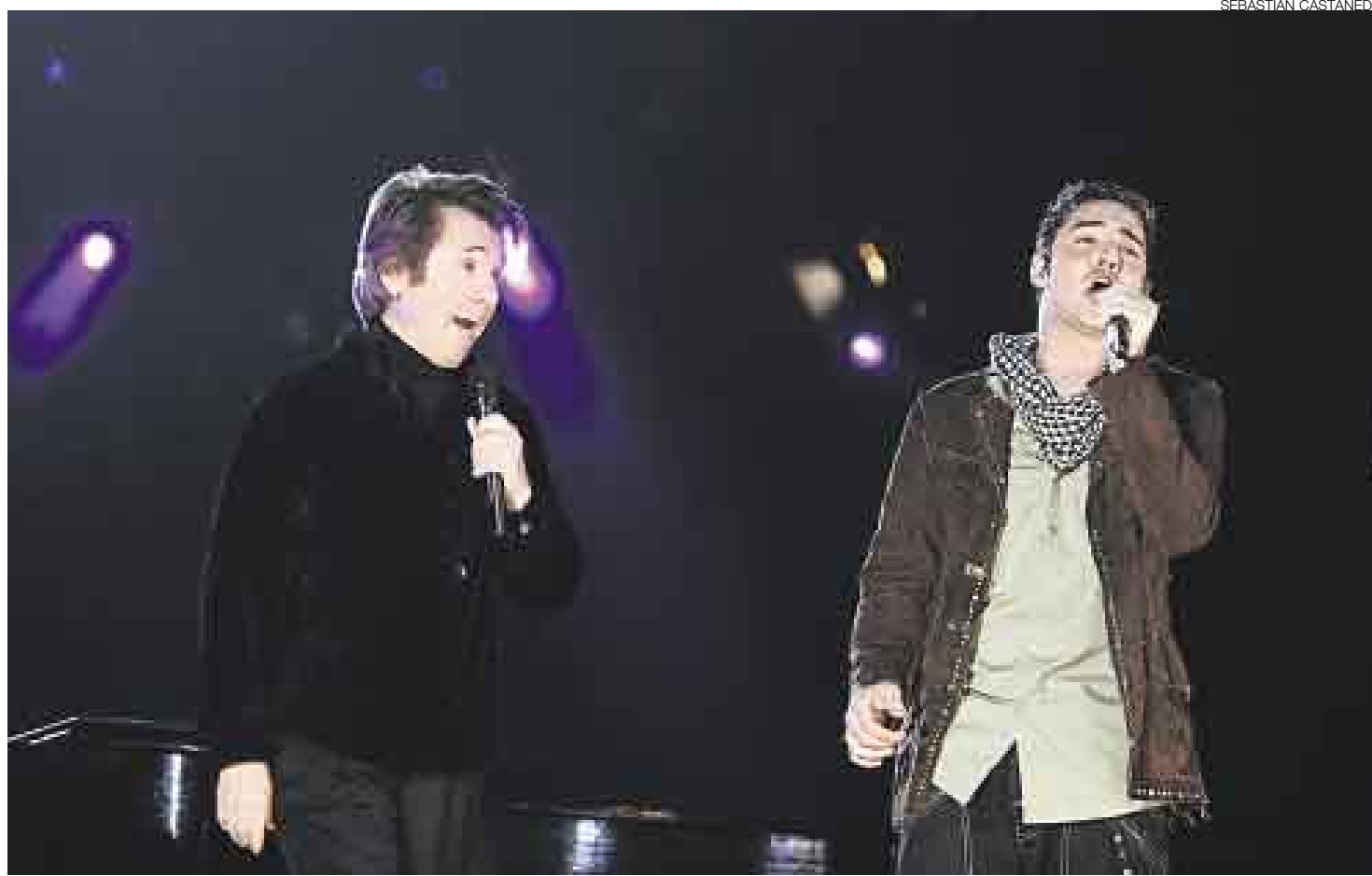
A ESTADIO LLENO. Raphael y David Bisbal derrocharon calidad anoche en el Estadio Nacional. También se presentaron Fito Páez, Alejandro Sanz y Hombres G, quienes cantaron junto con Gian Marco, Eva Ayllón y Pedro Suárez Vértiz. Fotos y videos del concierto en nuestra www.elcomercio.com.pe .