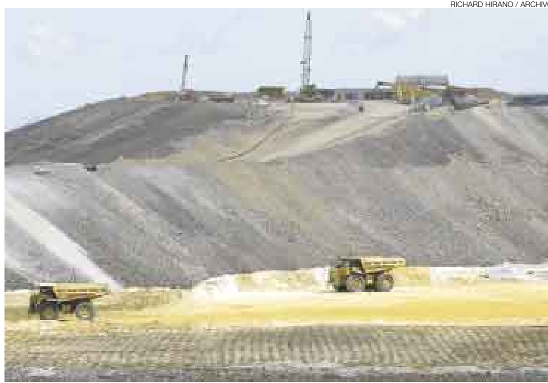
RICHARD HIRANO / ARCHIVO

El ex ministro de Economía sostiene que reducir la tasa gradualmente es el camino correcto a seguir, a medida que aumenten las utilidades de las empresas mineras y bancarias –que representan el grueso de la recaudación por Impuesto a la Renta–, y progrese