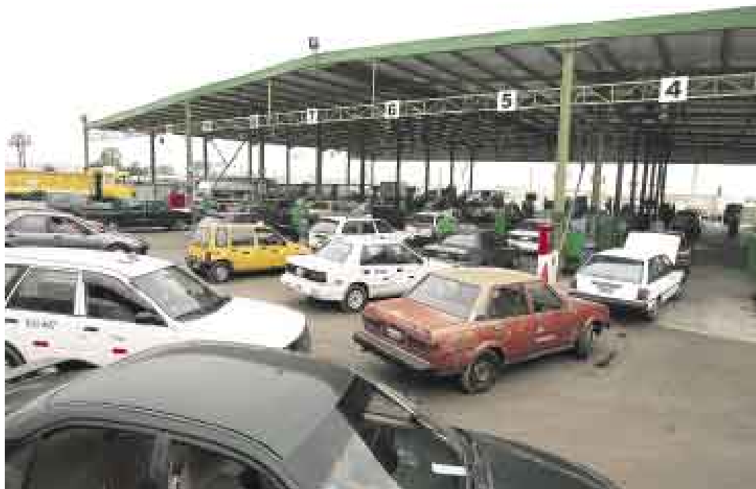
DE NUNCA ACABAR. El proceso de inspecciones vehiculares continuará aunque ambas partes ingresen a un proceso arbitral. Solo se detendría si el concejo pide una medida cautelar paralizando las labores.