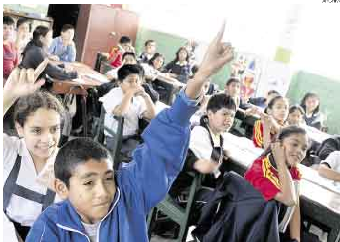
LECCIÓN APRENDIDA. En el reporte del World Economic Forum, el Perú se encuentra en el último lugar en cuanto a calidad de educación primaria.

el ámbito nacional, dando prioridad a los departamentos con mayores déficits, entre otras acciones.