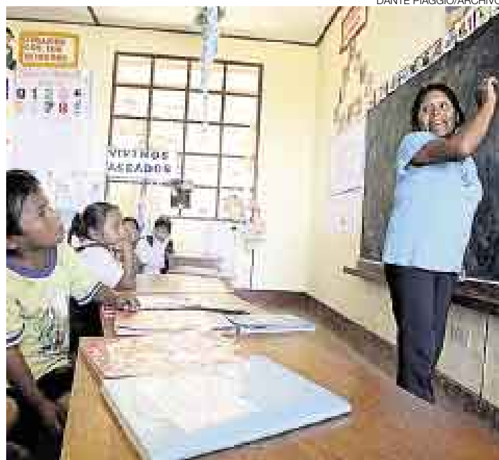
SIN NOVEDADES. La educación deberá seguir esperando tiempos mejores para que pueda contar con más recursos que permitan su desarrollo.