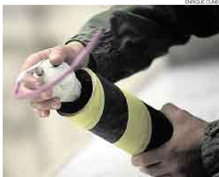
PELIGRO A LA VISTA. Una bombarda no solamente puede generar luces multicolores y un fuerte sonido, también puede herir a una persona.

Otro gran problema es que estos lugares informales donde se fabrica y almacena inapropiadamente material pirotécnico generalmente están ocultos. Cuando acudimos a una emergencia, lo hacemos con la seguridad de combatir un incendio convencional, pero nos vemos sorprendidos con un siniestro que involucra material peligroso. Hay que combatir sin tregua a los informales.