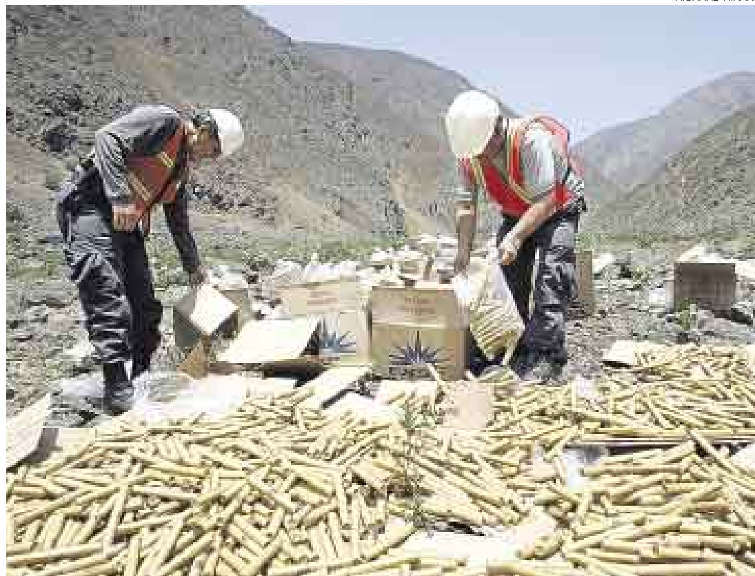
POR TONELADAS. Los explosivos incinerados ayer por la Dicscamec pudieron haber sido destinados a la fabricación de artículos pirotécnicos altamente peligrosos que luego hubieran sido vendidos en la ciudad.

Sin embargo, y pese a los esfuerzos de las autoridades por acabar con la fabricación y comercialización ilegal de productos pirotécnicos, la venta de estos continúa en algunas zonas de la capital, tal como ocurre en la zona de Piedra