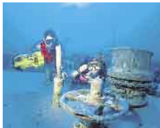
BAJO EL AGUA. El buceo es una de las actividades más buscadas y practicadas por los visitantes.

de todo el camino encontrará diferentes lugares donde podrá detenerse a comer algo o descansar.