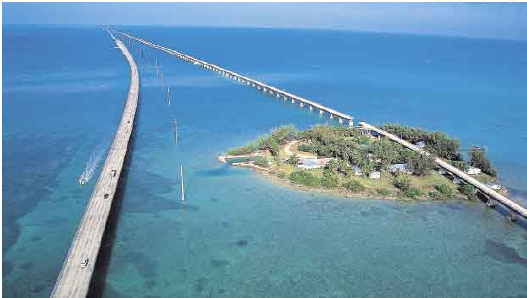
EN MEDIO DEL OCÉANO. El puente de las siete millas, también conocido como el muelle pesquero más largo del mundo, forma parte del camino hacia Key West y es el único acceso a Pigeon Key. Mientras se pasa por estos puentes puede observar el mar y, si desea, se puede detener para ver, a través de agua cristalina, el fondo marino y algunos peces.