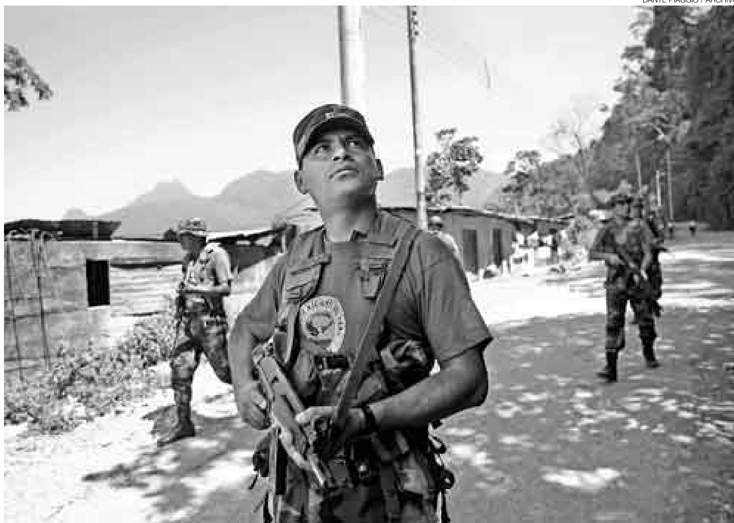
POR CAMINO SEGURO. En la lucha contra el narcoterrorismo es una responsabilidad fundamental de los cuerpos de inteligencia suministrar información oportuna y certera a las fuerzas del orden para que puedan desplazarse por las zonas cocaleras sin poner en riesgo sus vidas.