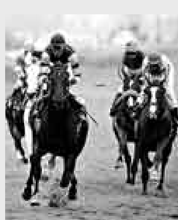
AL GALOPE. Monterrico se llenará de emoción esta tarde.

(1.000 m / 4:35 p.m.): 3ra. Mulita (1) Nouba 52 J. Balbuena. - No creemos. (2) Liliana Luisa 52 J. Monteza. - No corre. (3) El Bambú 54 J. J. Enriquez. - Pasa por gran estado. (4) Belén 52 R. Fernández. - Estuvo ligera de la gatera. (5) Kenyo 57 I. Quispe. - Los pasó de largo.