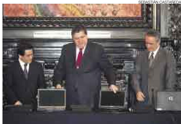
EN TRÁMITE. El ministro de Educación dijo que su despacho gestiona un precio preferencial para que los maestros accedan a Internet.