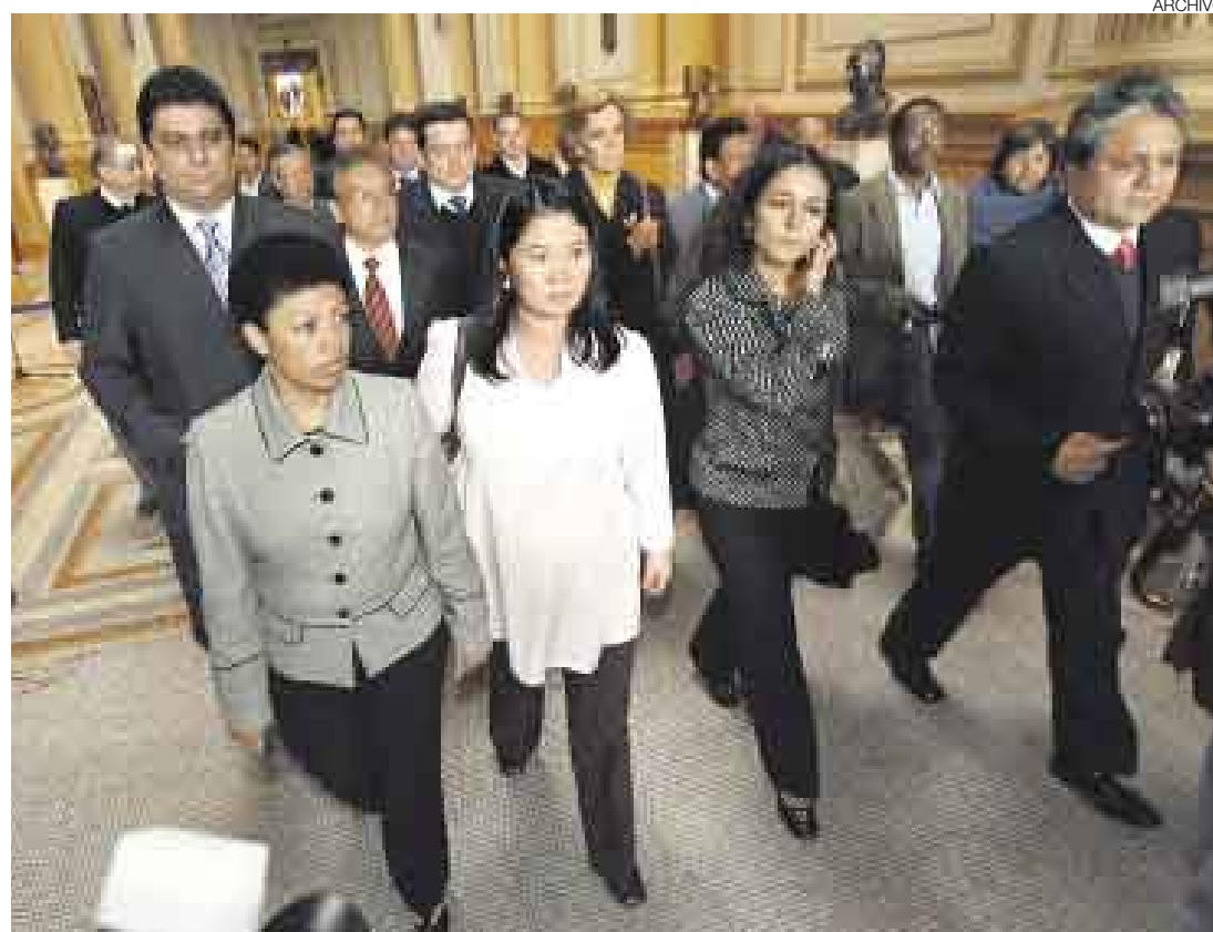
SIN ECO. La pretensión fujimorista contra Del Castillo quedó en eso. No tiene eco multipartidario.

En una declaración propalada a través de RPP, la hija mayor del ex presidente Alberto Fujimori dijo que hasta ahora no comprende por qué el Poder Ejecutivo no cumplió con presentar