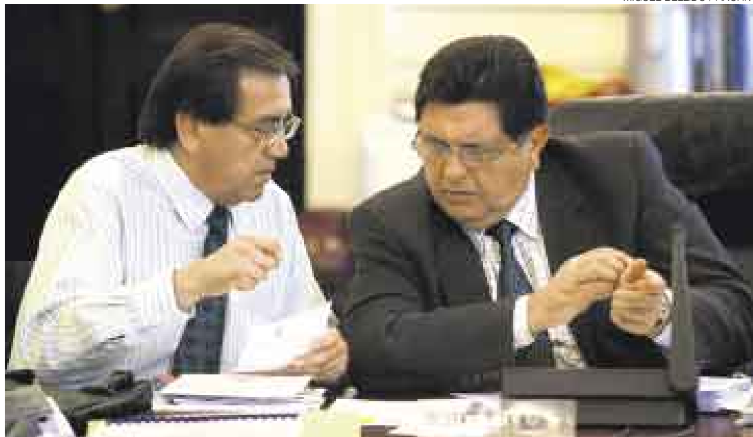
ELLOS TIENEN LA PALABRA. El primer ministro Jorge del Castillo secunda al presidente Alan García al afirmar que el Estado no debe ser traba para el desarrollo y la inversión.

El representante del empresariado opinó que el Congreso debe sumarse a esta preocupación del presidente aprobando los proyectos de ley que permitirán llevar a cabo las propuestas que García es-