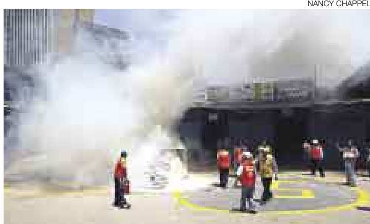
RESULTADO. Unos nueve heridos y tres puestos incendiados dejó ayer el simulacro de incendio y sismo. Participaron en él tres mil comerciantes.

Unos nueve heridos graves y tres puestos incendiados dejó ayer el simulacro de un sismo de 8 grados en la escala de Richter e incendio en el centro comercial El Huelco. Los tres mil comerciantes que participaron tardaron 4 minutos en evacuar la zona, según el informe final. La policía, la Oficina de Defensa Civil de la Municipalidad de Lima y los bomberos se encargaron de vigilar el simulacro.