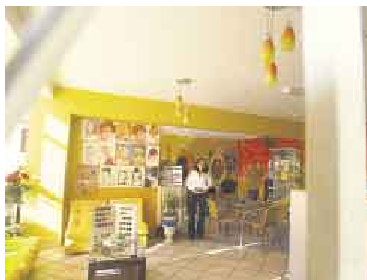
SAN BORJA. El instituto Virgen María Milagrosa no pudo revalidar las carreras de Administración y Computación. Ahora ofrece Cosmetología.

También Alcabor, George Boole, Montemar, Esade, Ciencias y Alta Tecnológica Santa de Lima, Los Olivos, Peruano de Ciencias, San Isidro, Telematic y En Seguros. Asimismo, los pedagógicos privados Von Newman y el Instituto Superior Pedagógico Lima.