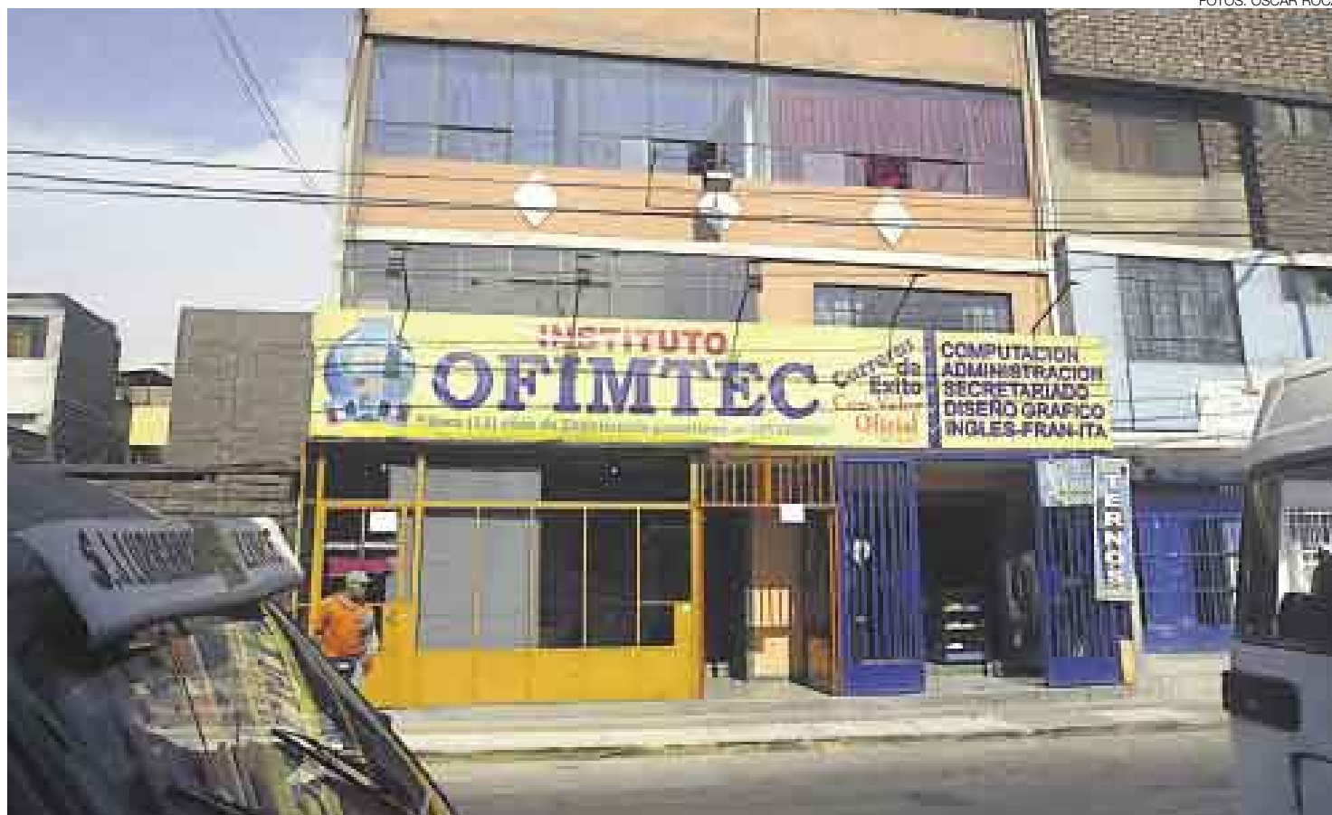
SIGUE OFERTA. El IST Ofimtec, en San Juan de Lurigancho, ofrece cursos de computación y ensamblado de computadoras pese a que existe una resolución directoral que cancela su autorización de funcionamiento. Cobra 20 soles de matrícula y 80 soles por mes. Los cursos duran seis meses.

El funcionario explicó, sin hacer precisiones, que al menos el 70% de dichos centros de formación no ha entregado a la DREL actas y nóminas de alumnos du-