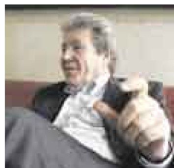
EDITOR. Jorge Herralde en la FIL.