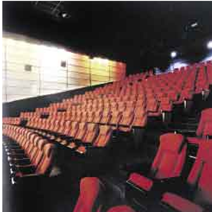
A OSCURAS. Libro investiga tanto en la historia de las desaparecidas salas de cine como en las nuevas salas múltiples.

★ EL JOVEN ARQUITECTO EGRESADO DE LA UNIVERSIDAD RICARDO PALMA ACABA DE EDITAR "ILUSIONES A OSCURAS", UN MAGNÍFICO Y AMBICIOSO LIBRO QUE REPASA LA HISTORIA DE LA ARQUITECTURA DE LAS SALAS DE CINE LIMEÑAS