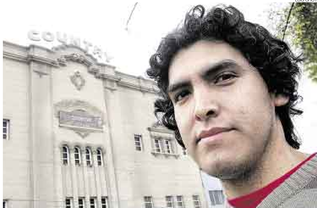
MEMORIA VIVA. El libro de Mejía recupera imágenes inéditas de salas de cine ya extintas.

En un plano urbano, podemos ver que allí donde Lima crecía, aparecían nuevos cines: a inicios de los años 20 estaban concentrados en lo que era el Rímac, el Cer-