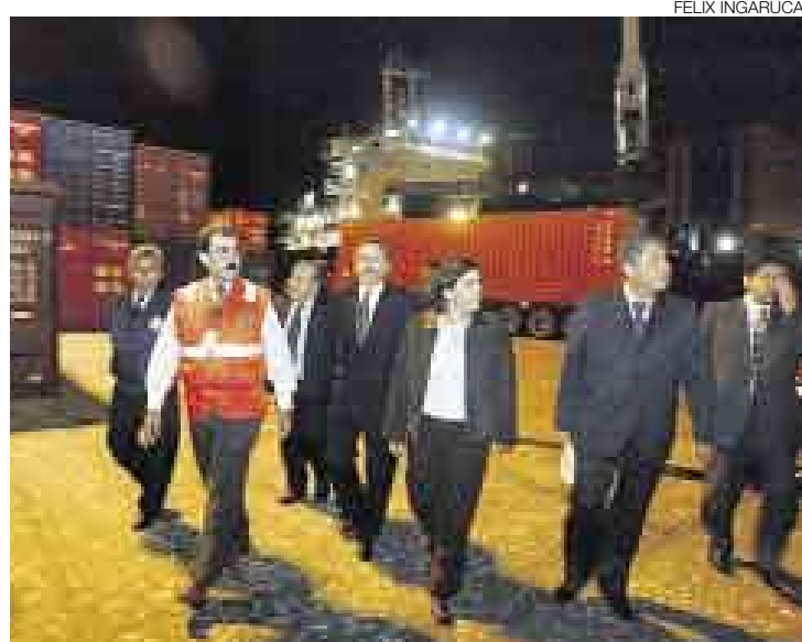
VISITA. La ministra Zavala fue al puerto la noche del viernes para verificar que algunos estibadores no impidan a sus colegas reanudar sus labores.

Este Diario comprobó que al menos 14 naves con mercadería de exportación e importación fue-