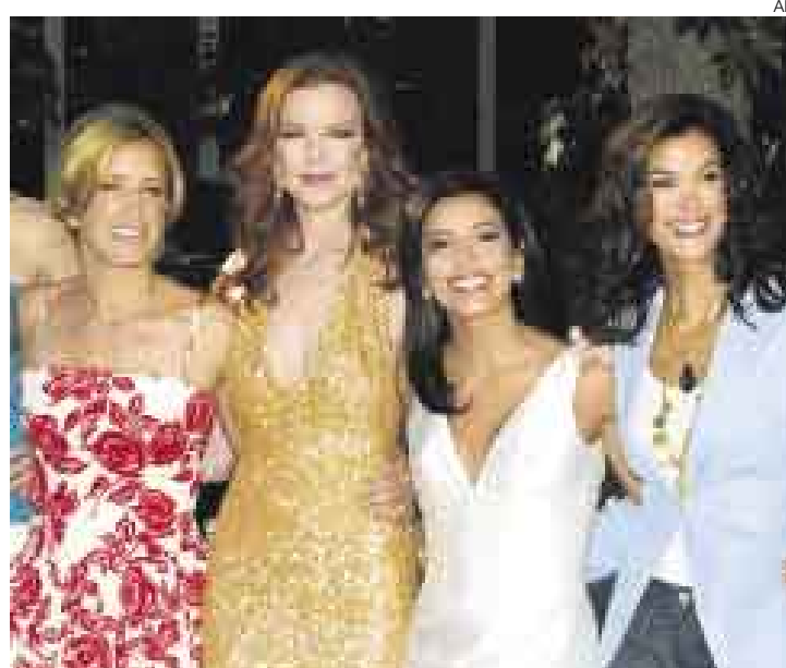
DIVAS. Felicity Huffman, Marcia Cross, Eva Longoria y Teri Hatcher.

Este noveno episodio de la cuarta temporada, titulado "Something's Coming", se caracterizará por la brutal presencia de un tornado que acabará con el barrio de Wisteria Lane, hogar de las bellas amas de casa Susan Mayer (Teri Hatcher), Lynette Scavo (Felicity Huffman), Bree van de Kamp (Marcia Cross) y Gabrielle Solis (Eva Longoria).