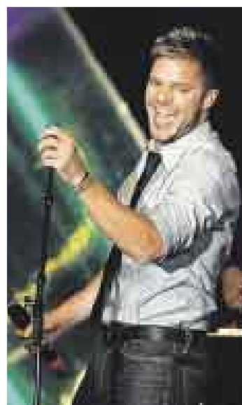
BORICUA. Revive la gira que Ricky Martin realizó en gran parte de Latinoamérica, EE.UU y Europa.

El ganador de dos premios Grammy Latino 2008 (mejor intérprete masculino y mejor videoclip) se toma un merecido descanso luego de concluir el "Tour blanco y negro". Sin embargo, su regreso a los escenarios parece ser inminente, pues tiene pendiente promocionar con Eros Ramazzotti el tema "No estamos solos" que cantan a dúo. ●