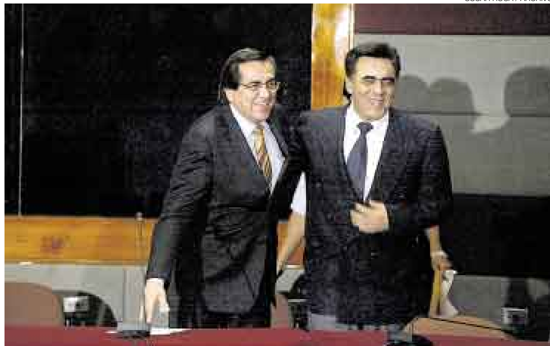
PERO SI SOMOS COMPAÑEROS... Como hace mes y medio, el primer ministro Jorge del Castillo recibió a Luis Gonzales Posada, solo que esta vez también estuvo la bancada aprista para coordinar la agenda parlamentaria.

En tal sentido, Gonzales Posada anotó que hay más de 150