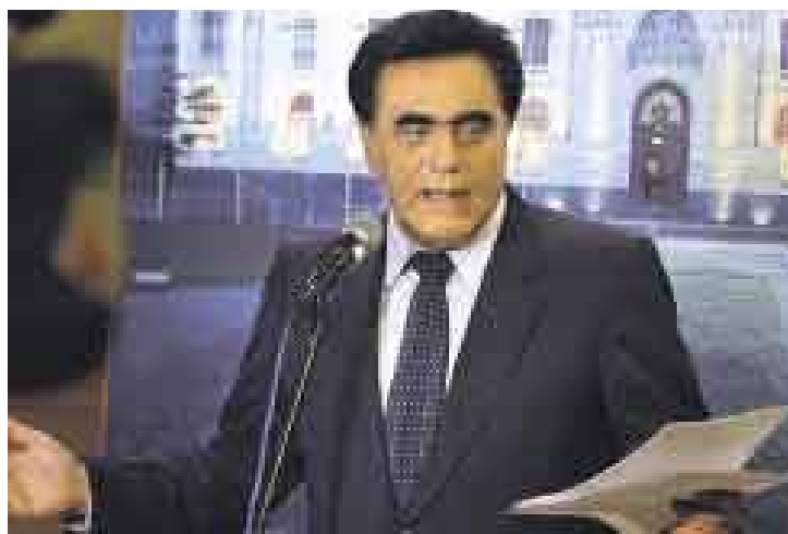
ORDEN. En la sesión matutina del Pleno de ayer hubo un público llamado al orden que recibió el presidente del Congreso, Luis Gonzales Posada.

Eso fue el colmo que rebasó el vaso de la paciencia del escaño auditorio parlamentario que soportó un manejo más que peculiar de la agenda. Quizás por