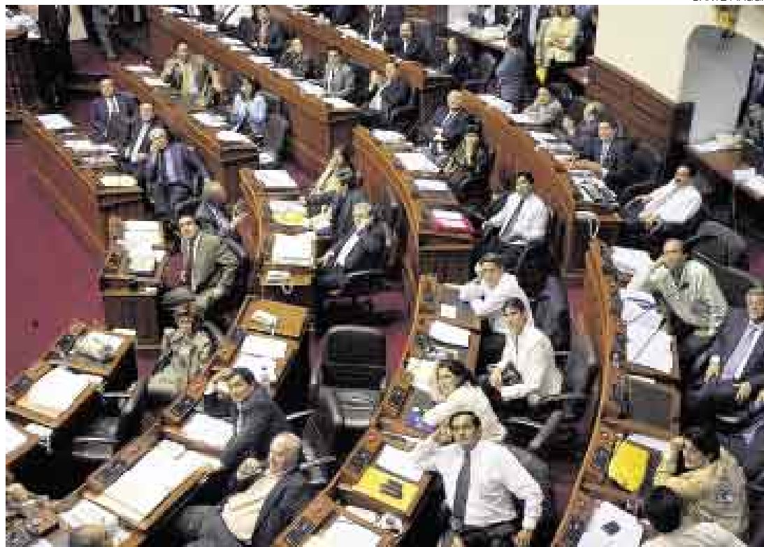
EN RECESO. Ayer fue el último pleno de la presente legislatura. Parlamento entrará en receso hasta el 1 de marzo.