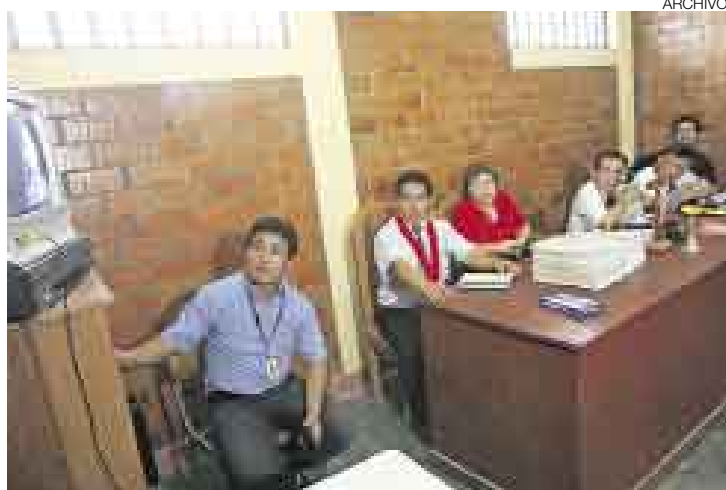
VICIADO. Debido a las irregularidades detectadas a lo largo del juicio del periodista asesinado, la Sala Penal Suprema puede declarar su nulidad.