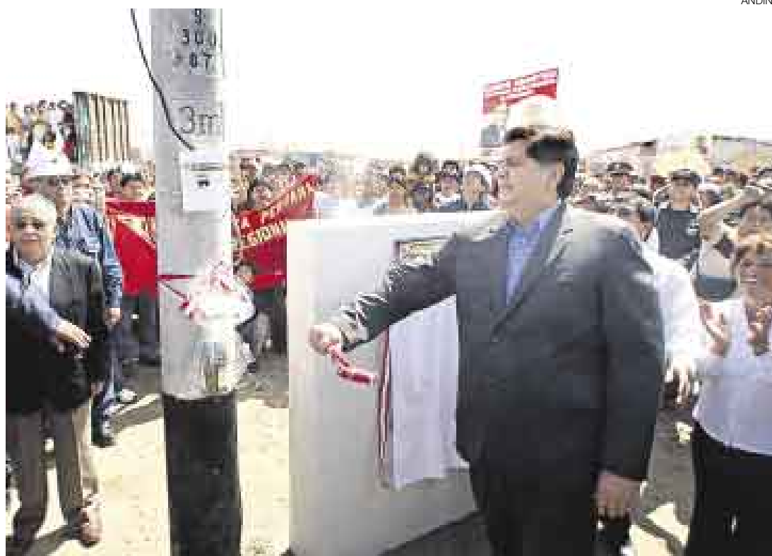
TODOS NUEVO. El presidente Alan García inauguró obras de electrificación en el distrito de Nuevo Chimbote.