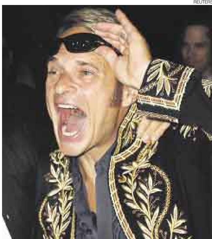
SIN COMPROMISO. Van estuvo casado 24 años con Valery Bettinelli.

En tanto, a Bertinelli, de 47 años, se le recuerda por sus papeles estelares en varias series de televisión, como "One Day at a Time" y "Touched by an Angel".