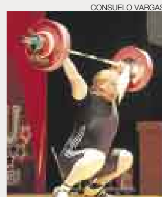
LEVANTA. Perú albergará otro torneo clasificatorio.