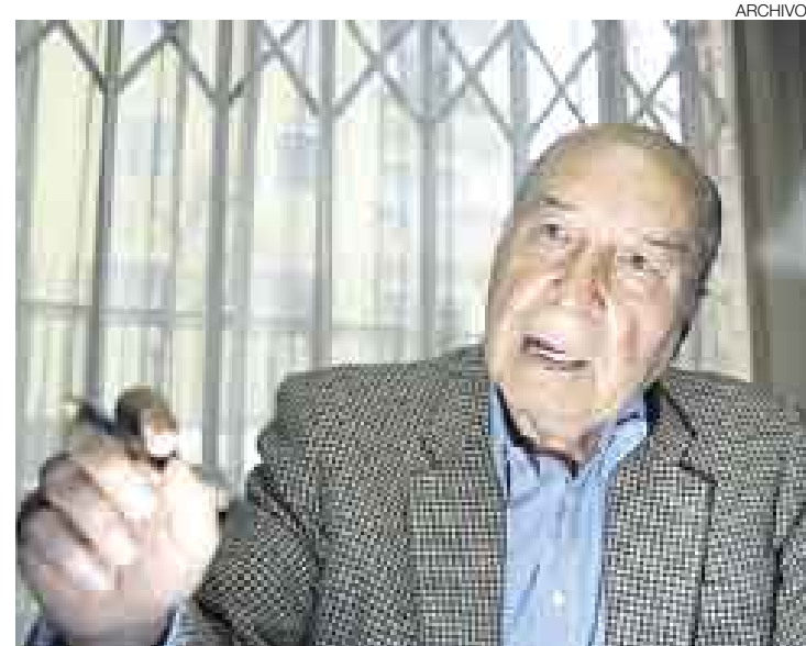
CITADO. Lector pide al Gobierno que no adelante opinión sobre el caso del ex presidente Morales Bermúdez (ver: El general y la justicia).