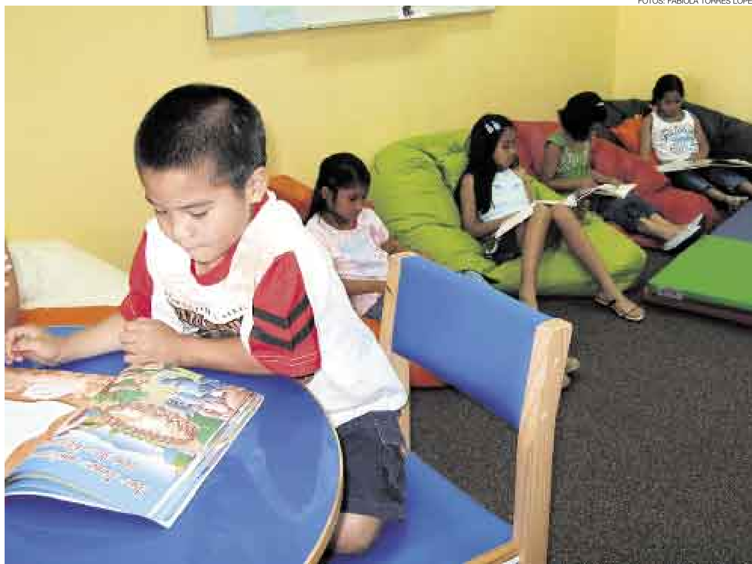
ESFUERZO. Es difícil ganar nuevos lectores, pero la sala infantil de la Biblioteca Nacional, en San Borja, es uno de los pocos espacios atractivos para los chicos.

Las donaciones de instituciones privadas o de personas altruistas son las principales fuentes de mantenimiento del acervo bibliográfico de las bibliotecas públicas. Los textos donados sirven, pero no siempre se adecúan a los públicos específicos de la biblioteca. "Si lo que se ofrece está desactualizado y no