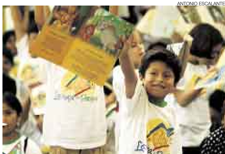
SIGUIÓ. El programa Lectura en Parques de Lima resistió los embates del invierno y se espera que se relance durante el verano.

En los parques de Ate-Vitarte, Carmen de la Legua, Cieneguilla, El Agustino, La Molina, La Victoria, Lince, Chosica, Magdalena del Mar, Miraflores, Puente Piedra, Rímac, San Isidro, San Juan de Lurigancho, San Luis, San Miguel, San Martín de Porres, Surco, Villa María del Triunfo y