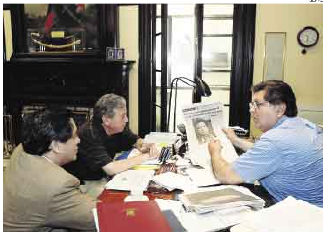
BIEN INFORMADO. El presidente comenzó el domingo con la lectura de El Comercio con sus ministros en Palacio.