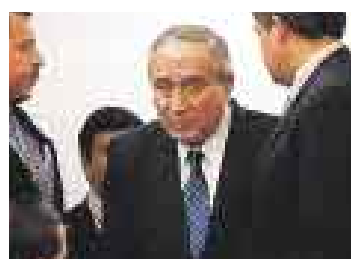
MANTILLA. Ya estuvo en prisión.