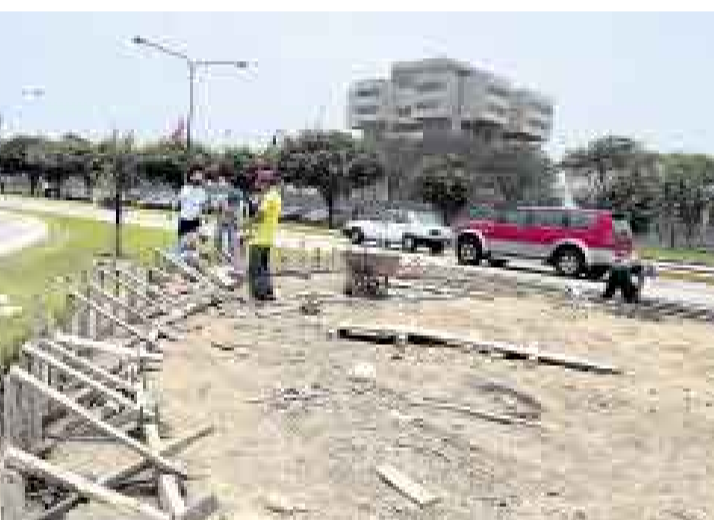
ÚLTIMAS OBRAS. El Concejo de San Borja construye senderos en el Parque de la Felicidad, frente al Pentagonito, y mejorará su iluminación.

“A nosotros que estamos casi a la espalda del Museo de la Nación no nos han vuelto a empadronar, lo hicieron para la cumbre pasada. Asumimos que esa información la seguirán usando. Hasta el momento no nos han avisado cómo vamos a transitar por la zona”.