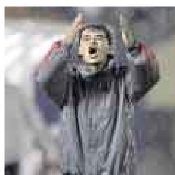
ORÉ. Tendrá que jugar otros choques para preparar a su equipo.

El objetivo es que el equipo de Oré llegue al menos con un