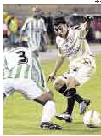
INCÓMODO. El delantero chileno quería regresar a su país.