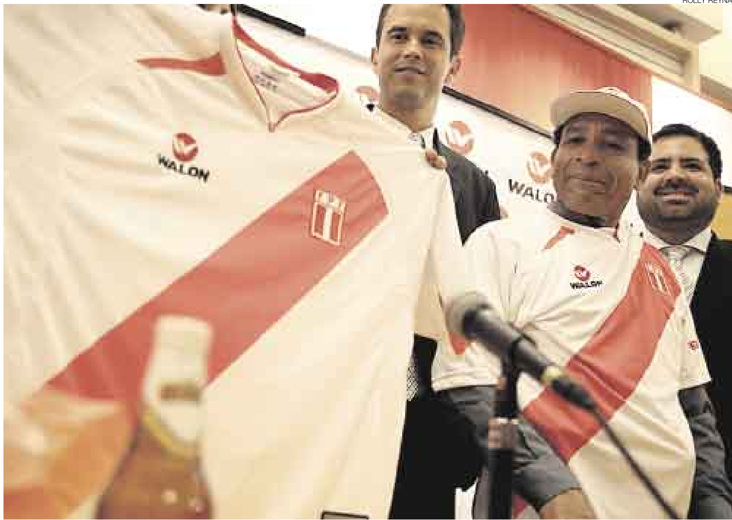
SÍMBOLO. El legendario 'Capitán de América' volvió a vestirse la blanquirroja pero solo para la presentación del nuevo modelo 2007.

El lunes llegan 'extranjeros' Los entrenamientos de la selección se suspendieron desde ayer por las elecciones en la FPF, pero el