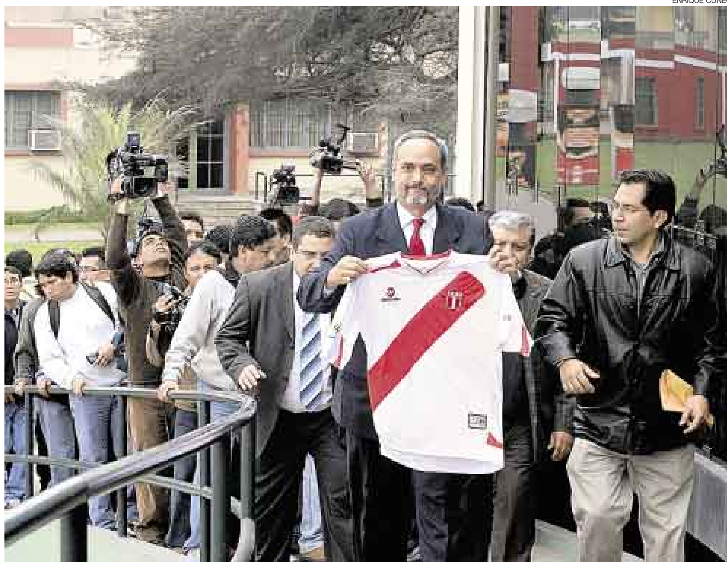
¿QUÉ PASARÁ? La reelección de Manuel Burga pone en altísimo riesgo la participación de Perú en el Mundial Sudáfrica 2010, según el ministro Chang.

Con solo la mitad de los clubes profesionales a su favor y una mínima aprobación en la opinión pública, así llegó Manuel Burga a las elecciones. Los tres clubes grandes (Universitario, Alianza Lima y Cristal) tampoco lo res-