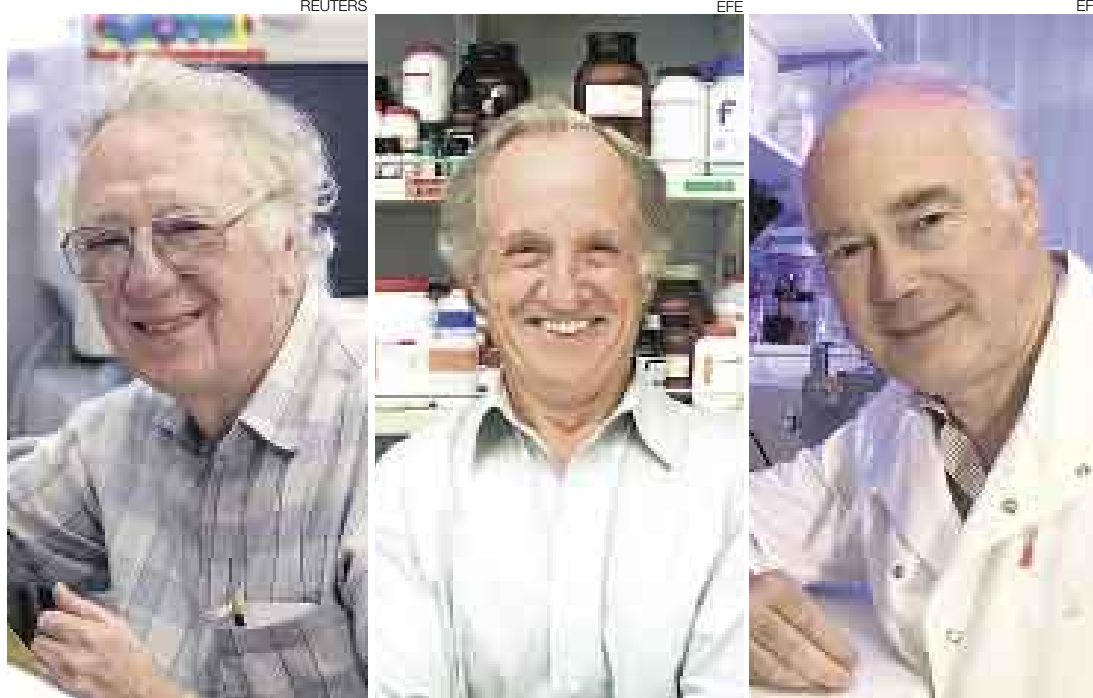
ELLOS SON. Los estadounidenses Oliver Smithies, Mario Capecchi y el británico Martin Evans fueron proclamados ayer premios Nobel de Medicina. El trío ya había recibido otro galardón por su trabajo genético en ratones.

Según el Comité Nobel, los descubrimientos de los tres ganadores permitieron desarrollar una tecnología de inmensa im-