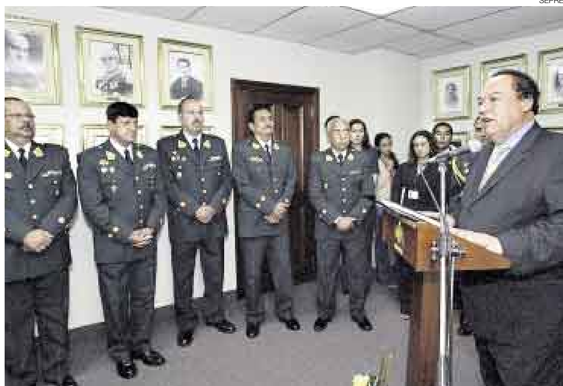
¿MANO DURA? El ministro Alva Castro solamente reasignó a altos oficiales involucrados en irregular compra.

Este cargo no es menos importante que el anterior, ya que maneja, entre otros, el Fondo de Vivienda Policial (Fovipol), el Fondo de Apoyo Funerario (Fonafun), el Fondo de Seguro y Vida (Fonsevid) y la División Central de Crédito.